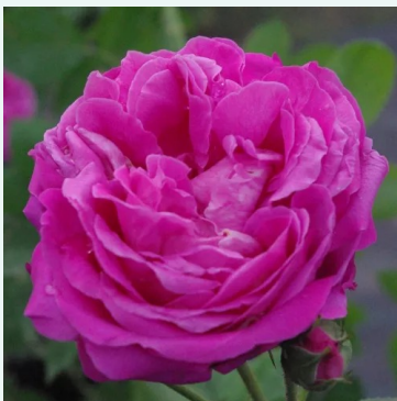
Duchesse de Rohan

rosa - historisch, china-rose 120-180 cm stark, gut wahrnehmbare duftrose - süßlich, klassisch- rosiger charakter Jean Laffay