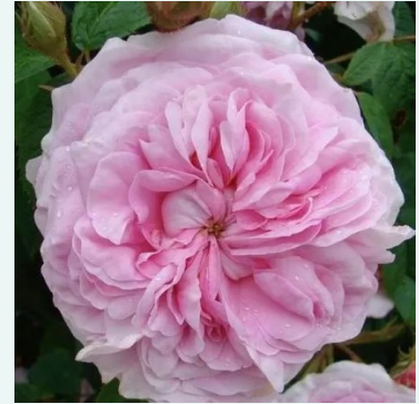
New Maiden Blush

rosa - historische, perpetual-hybrid-rose 110-160 cm sehr stark duftende, schon aus großer Entfernung wahrnehmbare rose - intensiv süß, teeartig, rosenhaft Henry Bennett