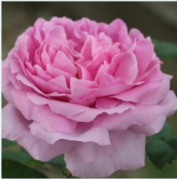
Comte de Chambord

rosa - historische, portland-rose 80-130 cm sehr stark duftende, aus der ferne wahrnehmbare rose - klassischer damaszener charakter André Robert; François Moreau