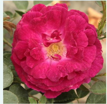
Trompeter von Säckingen

purpurrot - historische, remontant-hybride rose 160-250 cm stark, lang anhaltend duftende rose - voll, damaszener- rosig François Lacharme