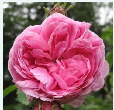
Rose des Peintres

purpur - historische rose, portland-rose 85-135 cm sehr stark duftende, von weitem wahrnehmbare rose - klassisch, rosenartig