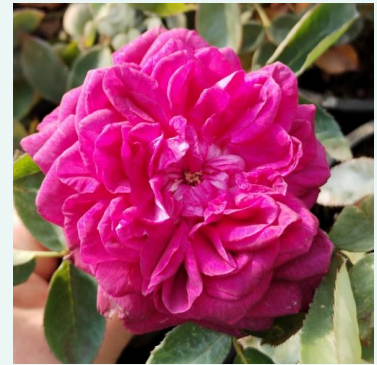
Arthur de Sansal®

weiß - historisch, alba-rose 280-420 cm mittelstark duftende, gut wahrnehmbare rose - würzig, fruchtig Rudolf Geschwind