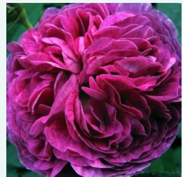
Belle de Crécy

rot - historische, perpetual-hybride rose 100-150 cm sehr intensiver, den garten erfüllender duftende rose - reich, altrosencharakter Reverchon