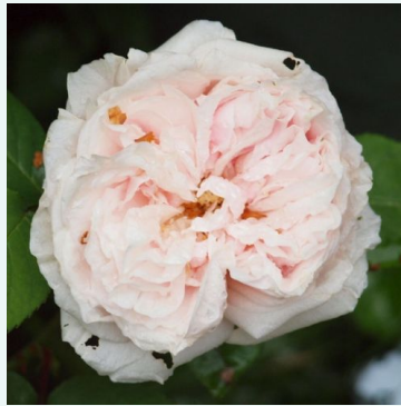
Änchen von Tharau