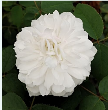
White Jacques Cartier

purpur-lila - historische, gallica-rose 120-190 cm mittelstarke, gut wahrnehmbare duftrose - samtig, leicht beerenfruchtig -