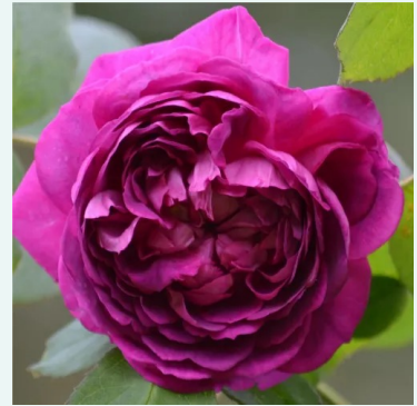
Reine des Violettes

rosa - historische, bourbon-rose 150-260 cm stark, voll duftende rose - voll, klassischer rosencharakter Mauget