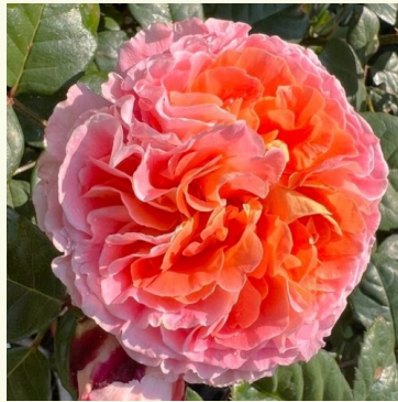
Notre Dame du Rosaire

cremefarben - nostalgische rose 100-150 cm kräftig, langanhaltend duftende rose - duftbeschreibung nicht verfügbar L. Pernille Olesen, Mogens Nyegaard Olesen